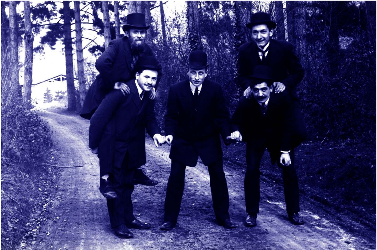
Tourloulous de cabaret (comiques troupiers) à Bligny juste avant la Première Guerre mondiale