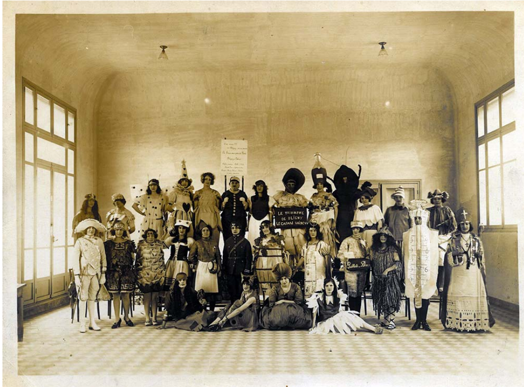
Des pensionnaires-artistes de Bligny costumés pour une opérette, écrite, montée, construite et jouée sur place : Le Cafard vaincu ». 1921.

Entre les deux guerres, la « méthode Bligny » a été adoptée par la quasi-intégralité des sanatoriums de France, transformant radicalement la vie et le devenir des pensionnaires de longue durée des sanatoriums, quelle que soit leur condition sociale. C'est Bligny encore qui a inventé le concept de « projet de sortie » lors que traditionnellement l'on ne sortait jamais d'un sanatorium, si ce n'est les pieds devant.